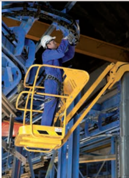
MANTENIMIENTO Y LIMPIEZA INDUSTRIAL