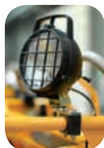
Faro de trabajo