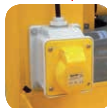
Toma eléctrica en cesta