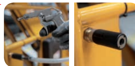
Línea de aire comprimido en la cesta