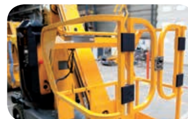
Entrada con barra móvil