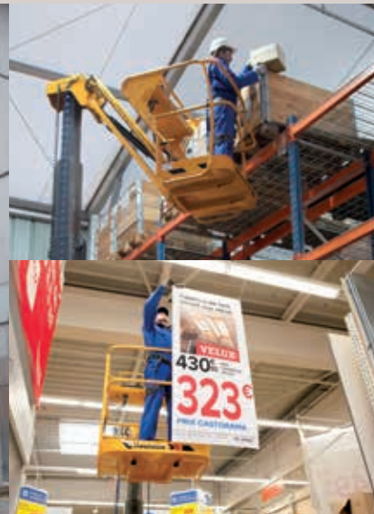
LOGÍSTICA Y DISTRIBUCIÓN

(iluminación, señalización, reparación...)