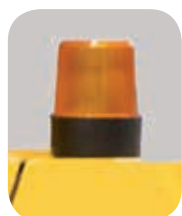
Luz de flash