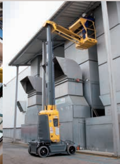
MANTENIMIENTO Y TRABAJOS DE OBRA MENOR EN EXTERIOR

(electricidad, iluminación, fontanería, pintura, climatización, tuberías, sistemas de detección de incendios...)